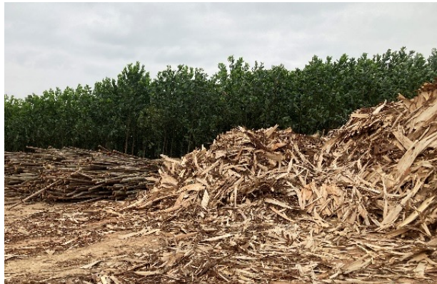
Thu gom phế liệu gỗ ở Tuyên Quang