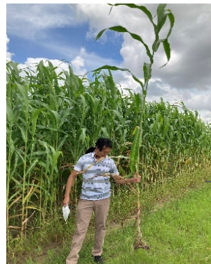
Nhiên liệu mới từ cây cao lương

Phế phẩm lâm nghiệp từ cây keo, bạch đàn